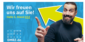
Abb. 1: Besuchen Sie DMRZ.de auf der Taximesse – an Stand A12 in Halle 1.